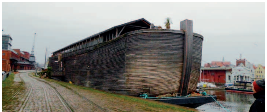
Havnen i Lübeck.