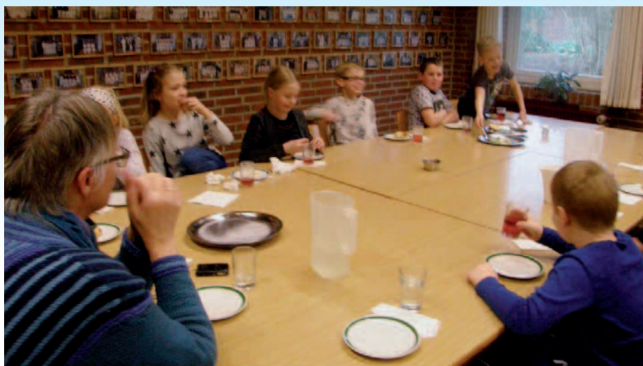
Omkring en forfriskning.

Jeg undviger ensomheden, når jeg er i dårlig humør.